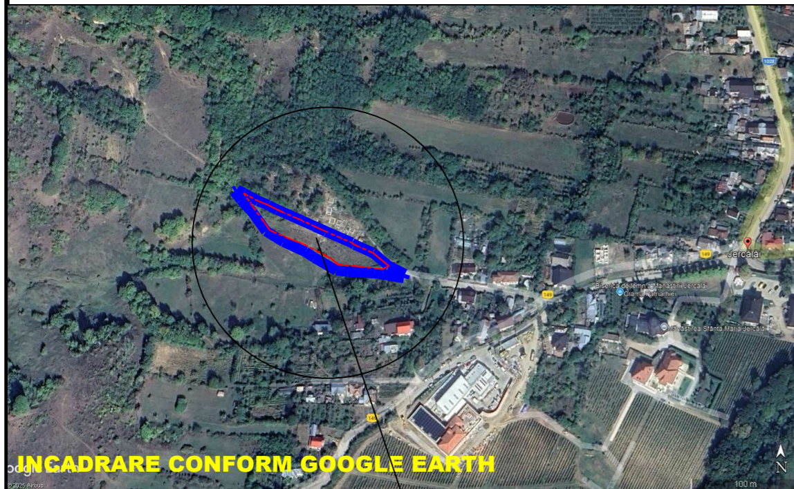
INCADRARE CONFORM GOOGLE EARTH